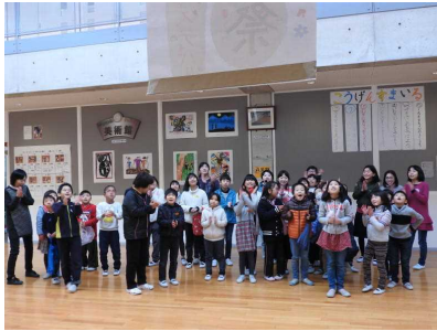
←高原スマイル祭の垂れ幕が2階から放たれ、歓声上がる。