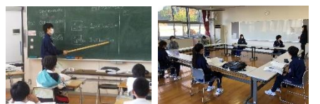
播磨高原東中4人、県立大附属中3人