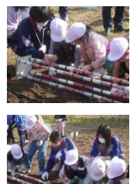
トライやる・ウィークの中学生が手伝ってくれました。

11月11日、1・2年生が光都チューリップ園で球根植えを行いました。来年も色とりどりの美しいチューリップをみんなどで見に行きましょう。